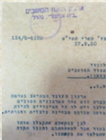
פניה לארגון המושבים, 1950