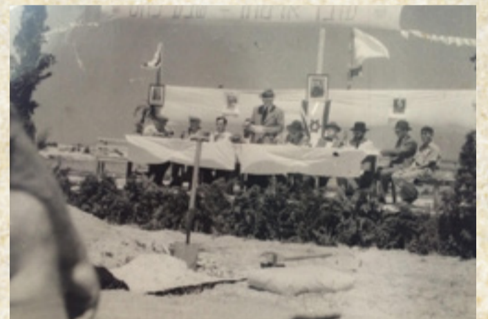
הבמה בטקס העליה על הקרקע, 1950