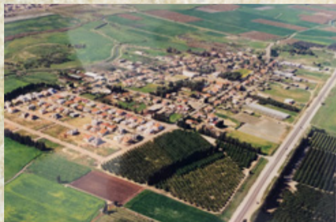
מושב בית חנניה במלאת יובל להקמתו, 2000