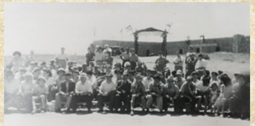
ביום טקס העליה על הקרקע. ברקע "בית החווה" (הצרכניה), 1950

היה זה אמצע הקיץ, נחל תנינים מלא במים זורמים ונקיים ולפני ששבו למשאית בחזרה לקלמניה, חלק מהחברים ירדו לטבול בנחל. מצפון לגבעה היתה אדמת ביצה שלא ניתן לבנות עליה בתים או לטעת עצים. הוחלט לבנות את הבתים מדרום לגבעה, על האדמה החולית שסביב חוות פוזי בק (היום- בניין הצרכניה) ומדרום מזרח יטעו הדירים (הפרדס ניטע ב-1956).