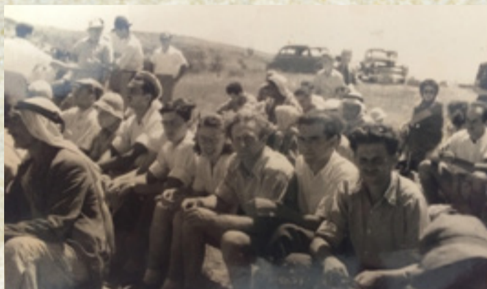
חברים נוכחים בטקס העליה על הקרקע, 1950