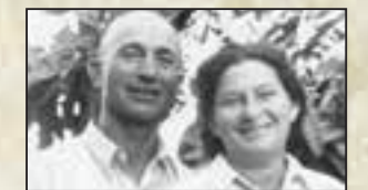
אושרי טובה וחיים