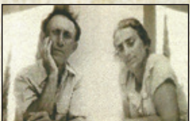
אפטר לאה וזאב