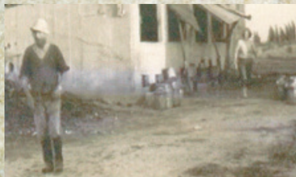
פרל ודוד כגן עובדים ברפת, תחילת שנות ה-50