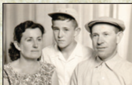
גנץ חיה ואביגדור