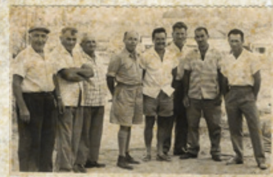
צעירים ומבוגרים יחד עומדים מול האתגרים