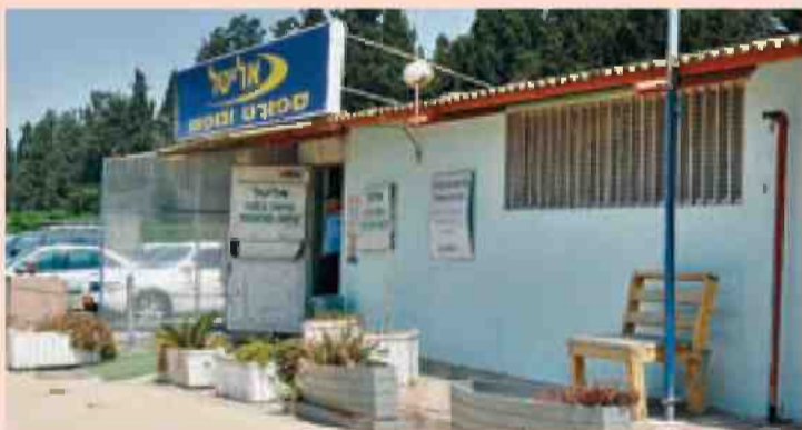
חנות אליטל בבצרה. "מי ירוויח מזה שהמתחם ייהרס?"

זה לציבור. המדינה החליטה שבית קפה בכפר זה פשע. למה? הרי אדם בן 80 לא יכול להתפרנס מחקלאות, ובכל זאת מביאים אנשים גם בגיל 90 להעיד בבתי משפט כעבריינים. ראיתי את האבסורד בחוק, והלכתי ללמוד משפטים, אני עו"ד ועד היום לא הבנתי מה ההיגיון במושג שנקרא 'שימוש חורג'. המניעים כאן לא ענייניים. במקום לשנות את החוק מהגדרות מעורפות כמו שימוש חורג, נותנים יד למדיניות של קריצות, בין אם מישוהו במינהל קורץ, או מישוהו בוועדות התכנון."