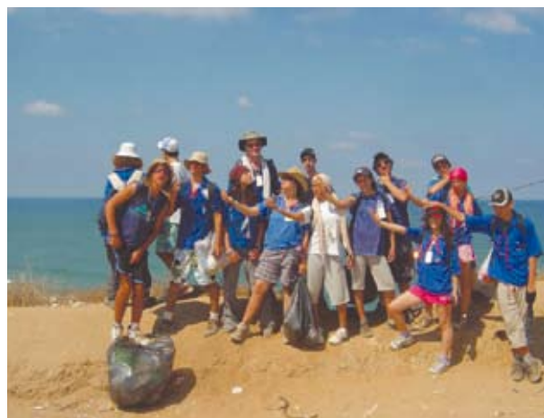
אוספים זבל במסע חוף.

"הומו" היא אחת הקללות היותר נפוצות היום. אז אנחנו לא סובלניים. אלימים. מקללים. הנוער של היום מדורדר. ככה הם אומרים. קל להם. קל להם לזכור את הטוב של פעם וקצת לשכוח שגם היום יש נקודות אור. שגם היום קורים דברים נפלאים. אז הדור שלנו לא יתפאר בהקמת דגניה או קיבוץ כינרת. והדור שלנו לא גויס לפלמ"ח