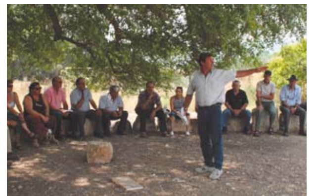
ועדת התיירות בסיור בדבורת התבור אתר תיירותי בגליל התחתון