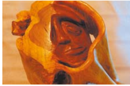
תשס"ח 8-2007. הנושאים שנבחרו ליומן התנועה: פרי ארצנו וללוח השנה: הצמח בגני. פיסול בעץ וצילום 7-2003