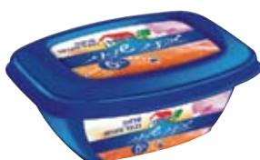
סלמון ובצל מעושן