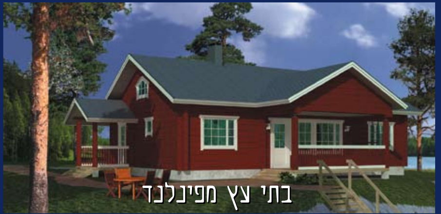
בתי עץ מפינלנד