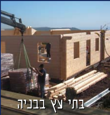
בתי עץ בבניה