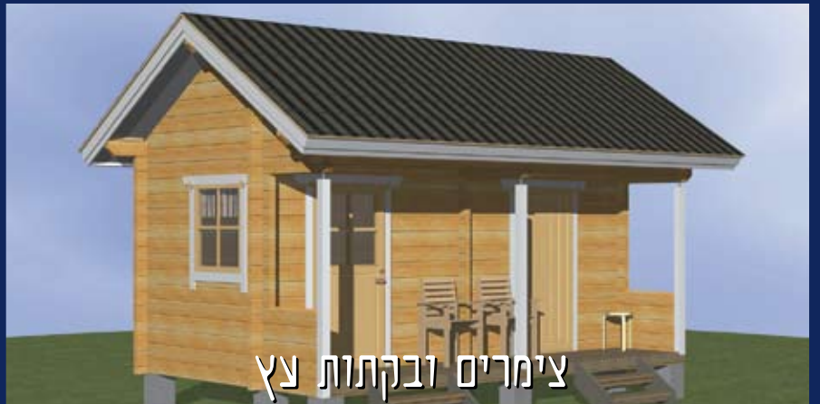
צימרים ובקתות עץ