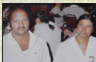
ידידה ודוד דוד