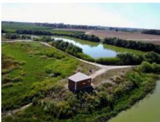
אגמון עמק חפר