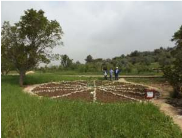
גן מעגל העיתים

בנוסף לכך, יוכל המבקר ליהנות גם מ"גן מעגל העתים" הבנוי כמעגל חודשי השנה, ובו מופיעות פריחות שונות בהתאם לעונה, כך שהמסייר בגן בסוף הקיץ יפגוש בפרחי החצב, ובזמן חג החנוכה ינעם לו ריחם של הנרקיסים. צומח הבר של ארץ ישראל מחבר בין הגינות השונות. ישנה גם חלקה ייחודית לצמחים בסכנת הכחדה, הכוללת גם צמחי מים הגדלים בבריכה. השמורה כולה מעניקה חוויה ייחודית ומעניינת למבקרים ותורמת גם למיזדה על הצמחייה, הטבע והחקלאות של ארץ ישראל כפי שהיו בתקופת התנ"ך והמשנה. מסלול הגן הבוטני כולל גם מתקני חקלאות קדומים, כגון גת, בית בד, טחנת קמח ומבנים עתיקים נוספים, שחלקם שוחזרו וחלקם נמצאו במקום.