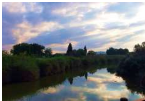
פארק גשר הצבים