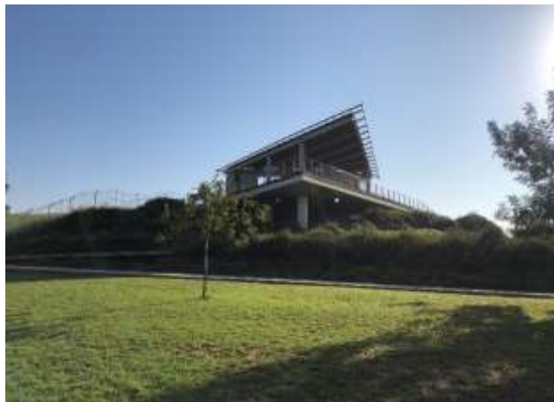
מצפור ויקר במאגר משמר השרון

קידום התיירות נעשה בהובלת צוות היגוי שהוקם במועצה, המשתף את הציבור והנהגות היישובים, לצורך איזון נכון בין הצרכים הכלכליים לאיכות החיים של התושבים בעמק. נושא התיירות מקבל ביטוי משמעותי בתכנית המתאר הכוללת של המועצה: בפיתוח אתרי לינה כפרית - קמפינג, אכסניות ומלונות בשימור מבנים היסטוריים ביישובים ומחוצה להם, כגון בית הראשונים בפיתוח ושמירה על המבואות החשובים, כגון חופי הים, נחל אלכסנדר, אגמון חפר