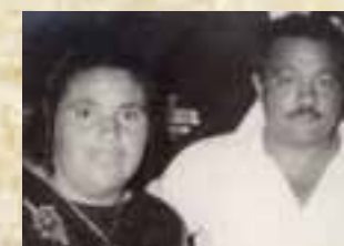
פדידה ז'ורז'ט ושלום