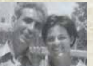
הרוש שמחה וציון